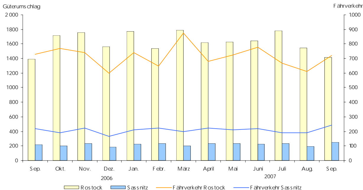
Entwicklung des Güterverkehrs in den Häfen Rostock und Sassnitz, darunter Fährverkehr (in 1 000 t)

1) einschließlich nicht ermittelter Häfen