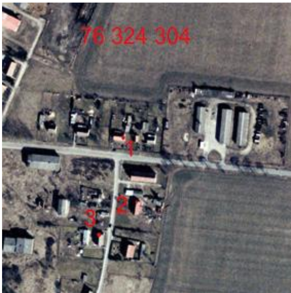
LuPa-Punktgruppe 76 324 304

LuPa liegen in Mecklenburg-Vorpommern landesweit flächendeckend als eindeutig definierte, nicht vermarktete, möglichst dauerhaft vorhandene Punkte vor, die an topographische Objekte (z. B. Gebäude, Fahrbahnmarkierungen) gebunden sind. Jeder LuPa besteht aus einer Punktgruppe von grundsätzlich drei unabhängigen Punkten.