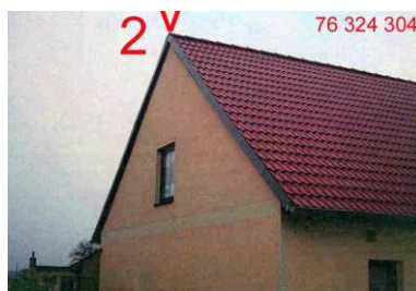
Punkt 76 324 304 2