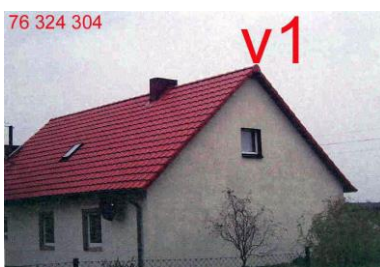
Punkt 76 324 304 1