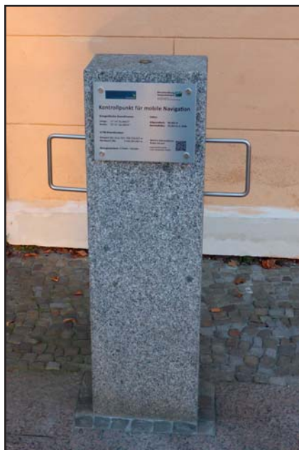
Kontrollpunkt mit Hinweistafel