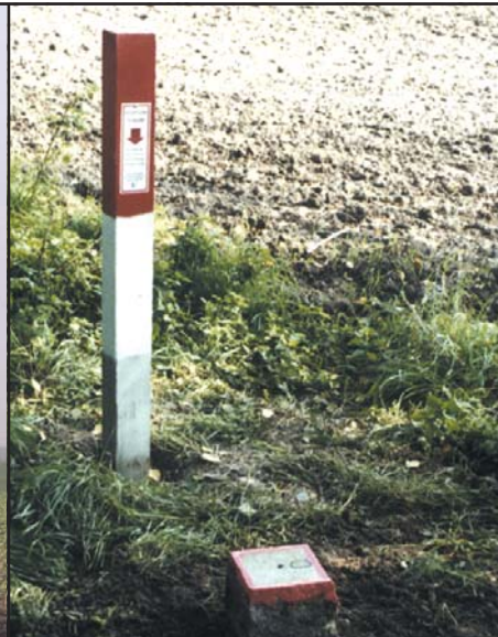
OP Granitpfeiler 16 cm x 16 cm mit Schutzsäule