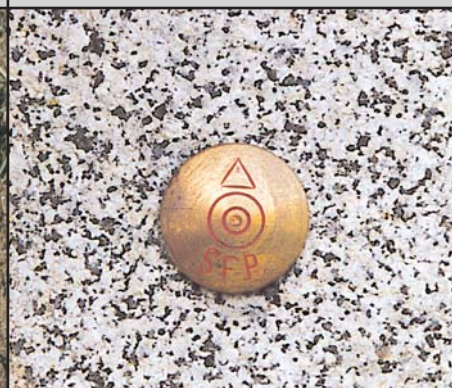
SFP Messingbolzen Ø 3 cm