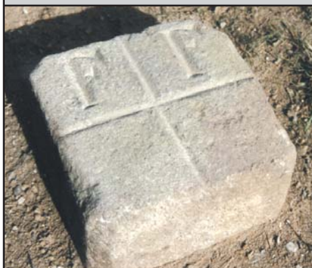
TP (Meckl.) Steinpfeiler bis 35 cm x 35 cm (auch mit Keramikbolzen)*