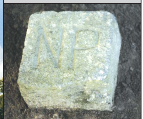
Markstein Granitpfeiler 16 cm x 16 cm mit „NP“