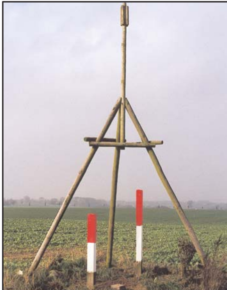
TP Granitpfeiler 16 cm x 16 cm mit Schutzsignal und Schutzsäulen