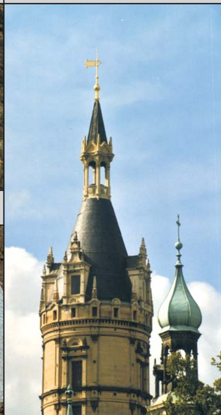
Hochpunkt (Turm Knopf u. a.)