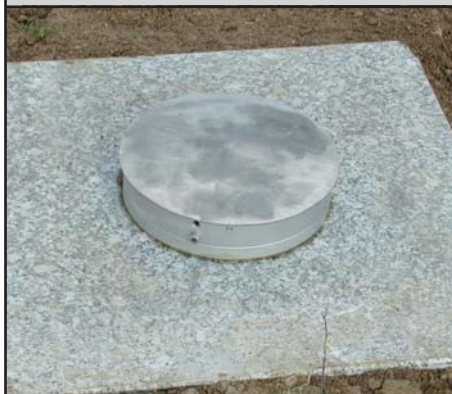
GGP Granitpfeiler 30 cm x 30 cm* oder 50 cm x 50 cm*