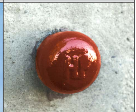
HFP Mauerbolzen (Ø 2 cm bis 5,5 cm) oder Höhenmarke