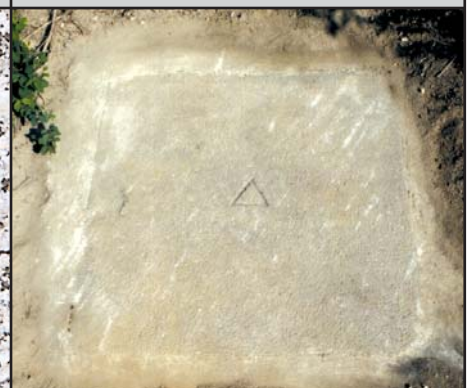
SFP Granitplatte 60 cm x 60 cm oder 80 cm x 80 cm