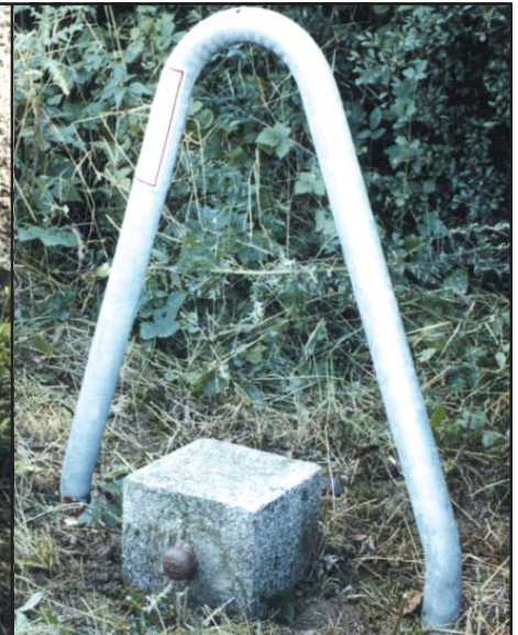
HFP Granitpfeiler 25 cm x 25 cm mit seitlichem Bolzen und Stahlenschutzbügel