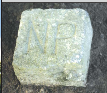
Markstein Granitpfeiler 16 cm x 16 cm mit „NP“