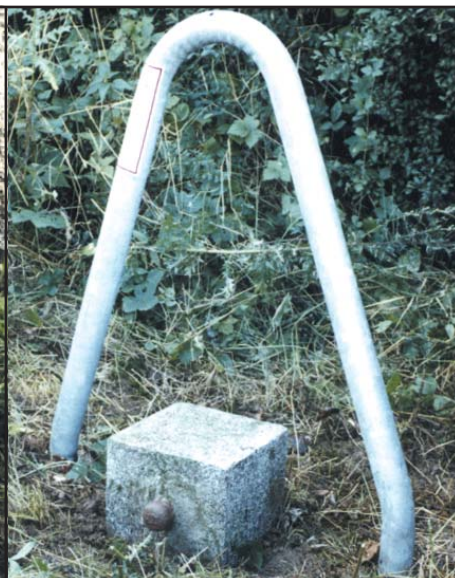
HFP Granitpfeiler 25 cm x 25 cm mit seitlichem Bolzen und Stahlenschutzbügel