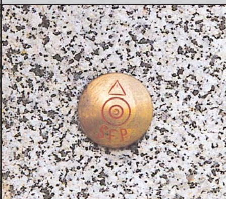
SFP Messingbolzen Ø 3 cm