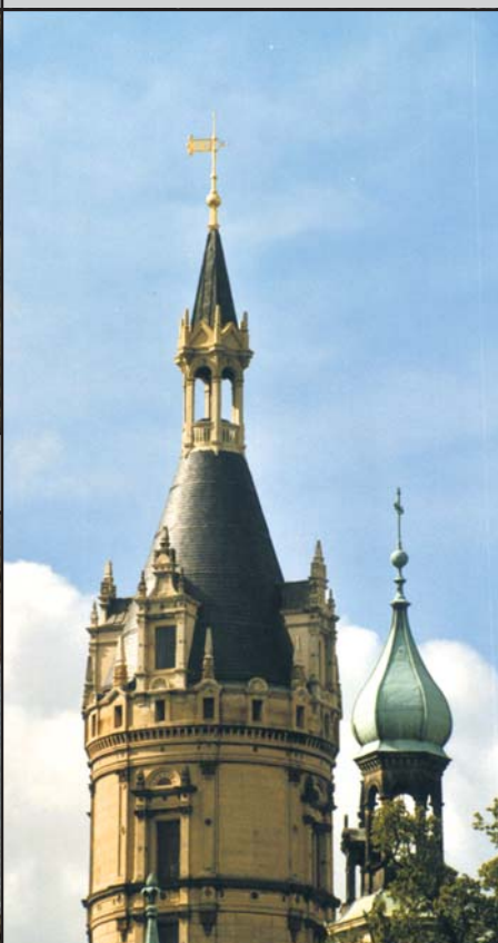
Hochpunkt (Turm Knopf u. a.)